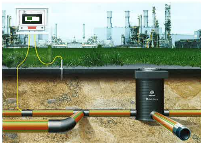
3L lekkasje kontrollrør (avløp) her skjematisk tegning av installasjon ved et industrianlegg.

Les mer på www.egeplast.no eller www.egeplast.eu